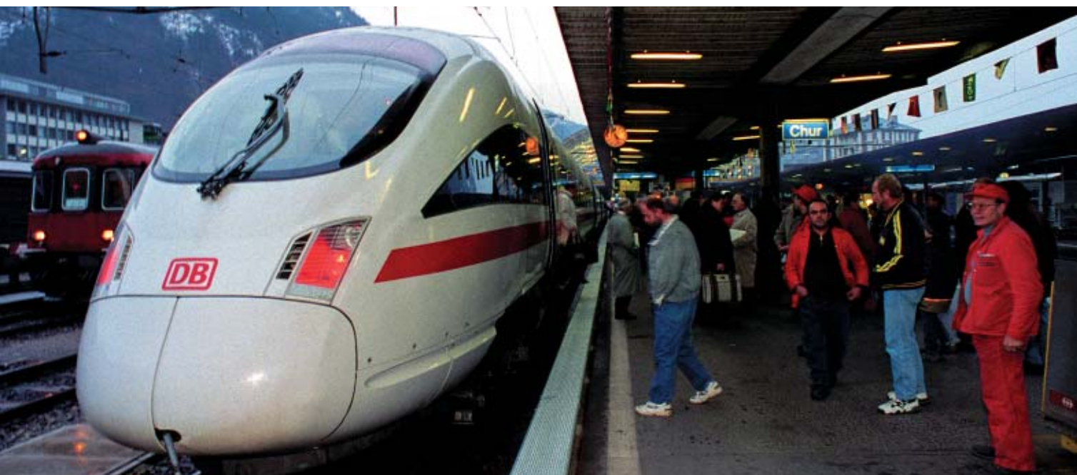
➤ Mit dem Anschluss an das europäische-Hochleistungsnetz rückt Graubünden näher an Europa.

Weiterentwicklung des Interreg-II-Projekt «Bodan-Rail 2020» ist. (Stopper ist u. a. einer der Initianten von Boda-Rail 2020, damals noch als Verantwortlicher des öffentlichen Verkehrs beim Stadtplanungsamt der Stadt Zürich).